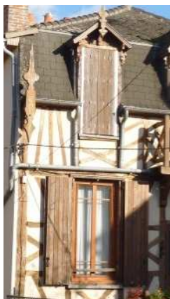
Pan de bois de décoration moderne