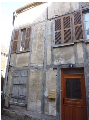
Pan de bois de structure