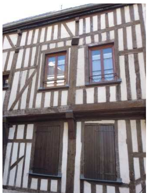
Pan de bois simple