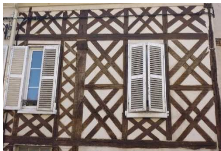
Pan de bois richement décoré