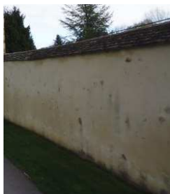
Mur enduit à pierre vue