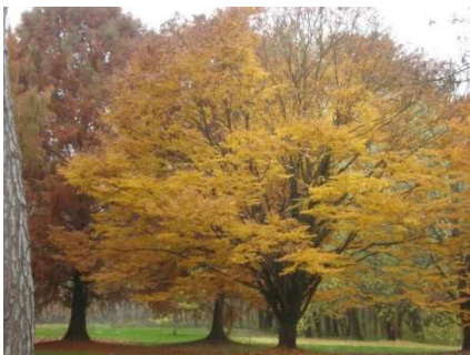
espace boisé protégé