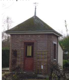
abri de jardin traditionnel