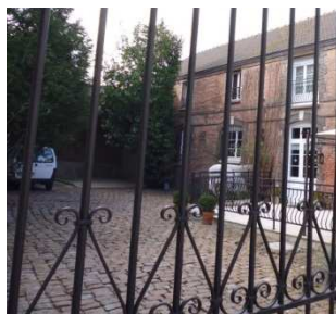
Cour pavée à conserver