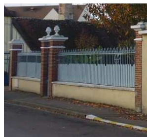
Mur bahut avec grille à barreaudage vertical partiellement occulté et piliers en briques et pierres sculptées