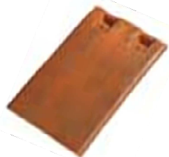
Tuile plate petit moule