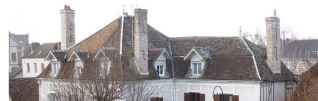
(tuiles, gouttières, cheminées, fenêtres de toit et lucarnes,...)

L'AVAP, en matière de couvertures, a pour objectif principal de les restituer selon leur composition d'origine