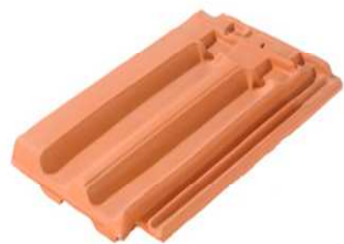
Tuile à côtes

9.4 • Aucune isolation thermique ou phonique par l'extérieur ne peut être autorisée sur les toitures des immeubles remarquables ou intéressants indiqués à conserver (en noir, en rouge ou en orange) au plan de délimitation de l'A.V.A.P.